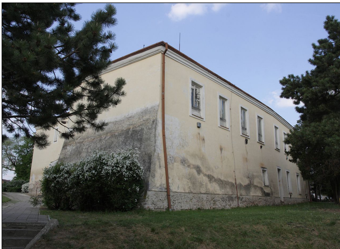
Současný pohled na zámeckou budovu ve Velkých Němčicích

R. 1753 Němčice, tehdy v podstatě už jen ves, koupil hrabě Bedřich Vilém Haugwitz a pokusil se neprosperující obec násilím osadit lidmi z jiných svých panství. Je doloženo, že tito osadníci z Němčic utíkali, mimo jiné před epidemiemi, jež byly ve své době vysvětlovány neudržovaností četných zdejších rybníků a bažin v okolí řeky. Byli proto dopravováni zpět a nuceni k práci násilím. Haugwitzové r. 1774 prodali městys Ditrichštejnům, čímž se poprvé v dějinách spojily Němčice s židlochovickým panstvím.