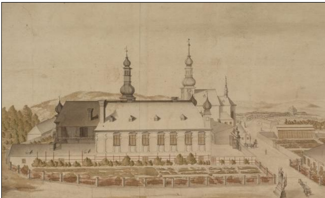
Zámek Velké Němčice r. 1836 (v pozadí kostel sv. Václava a Víta)